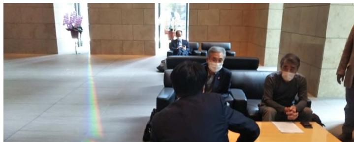
千代田区春闘共闘委員会主催で筆頭株主・みずほ銀行本店へ要請。第一勧業銀行時代から一貫して要請してきましたが、今回「筆頭株主でない」という担当者(株保有数2.04%)ガラス越しに反射光が「虹」として差し込む。