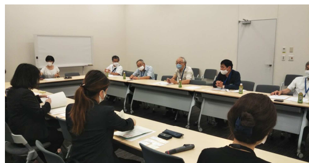
食品一般ユニオンと支援共闘会議・争議団が、中労委命令「付言」の立場で解決を求めている。その立場から政府に対するILOからの所見を求める要請。