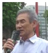
都労委闘争を明乳争議の集大成に

市川事件から36年、全国事件からでも27 年の長期争議を、様々な困難を乗り越え団 結して闘っている明乳争議団。この間、中労委命令の事実 認定と道理ある解決への道筋を示した「付言」を武器に、 門戸を閉ざす(株)明治及び明治HDの包囲運動に総力を 挙げていますが、今年は極めて重要な年になります。会社 包囲を継続して強め、同時に、都労委残留39件の調査を確 実に軌道に乗せ、これまで敗訴した単年度審査・判断の枠 組を乗り越え、全事件の併合審査・判断で年度を超えた格 差の存在を明確にし、「不当労働行為事件」としての認定 判断を目指す闘いです。まさに正念場、知恵と力を結集し 最後まで頑張る決意を申し上げ、新年のご挨拶とします。