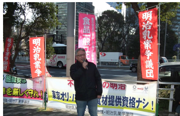
(株)明治がゴールドパートナー契約しているオリ・パラ組織委員会前(晴海トリトンスクエア)で不祥事と人権侵害で食材提供資格なし。宣伝・要請実施。