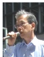
あけましておめでとうございます

睡眠薬入り水虫薬死亡事件は、社会に 衝撃を与え、明治HDの株価も下落して います。製造は小林化工、販売は明治製菓ファルマ、私 たちは、明治HDに対し遺族や社会に謝罪し、社会的責任を 果たすことを求めています。 明治乳業賃金差別争議に対し、中労委は人権侵害と賃金 格差を認定し、東京地裁も東京高裁も和解を求めまし た。他の大企業は、同様の争議をすべて話し合いで解決し ています。ところが、明治HDは、いっさいの話し合いを 拒否しています。私たちは、残されている39件を都労委に 申し立て、解決をめざします。この解決は、ステークホル ダーの皆さまの利害と一致します。よろしく願います。