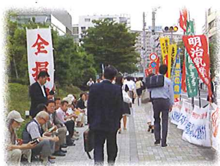
明治乳業本社前座り込み

明治乳業が抱える長期争議の「負の遺産」を明治製菓サイドから清算させることを求め「明治製菓本社」に迫ることにしました。